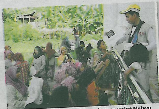
PESERTA menyebarkan risalah kepada masyarakat Melayu Campa.