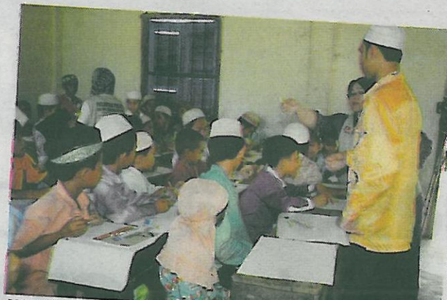
MASYARAKAT Melayu Campa menyertai program pengantarabangsaan.