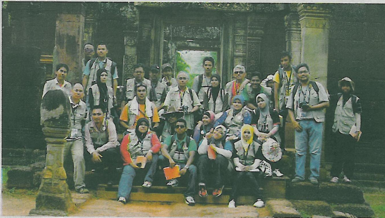
SERAMAI 20 pelajar pengajian warisan FTKW bersama pegawai pengiring bergambar kenangan di Wilayah Kamponcham, sempadan Siem Reap dan Phnom Penh.

Seramai 20 pelajar pengajian warisan FTKW bersama enam pegawai pengiring yang diketuai oleh Dekan FTKW, Prof Ma-