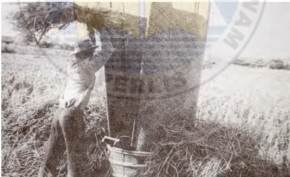
“Memukul padi” dalam proses menuai.

Padi yang dituai atau dihirik itu disimpan di dalam jelapang, kerubung ataupun kepuk. Mengikut kepercayaan orang-orang tua, hari untuk mengeluarkan padi dari dalam bekas-bekas tersebut sama ada untuk dimakan atau untuk dijual ditentukan juga. Hari yang dilarang ialah hari Isnin dan Jumaat. Meskipun begitu hari Jumaat dilonggarkan pantang-larangnya