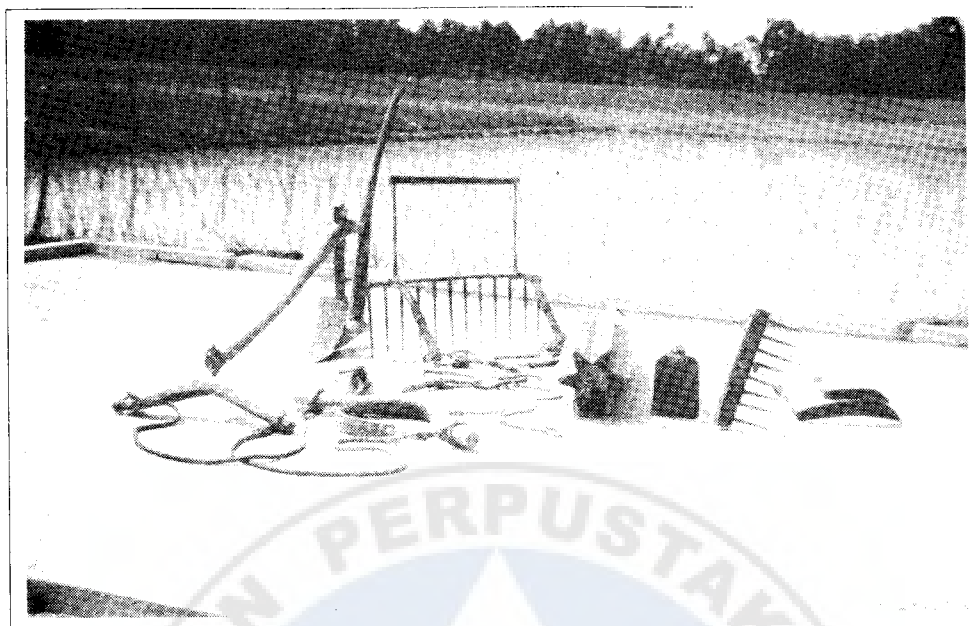
Alat-alat tradisional yang digunakan dalam kerja-kerja persawahan.