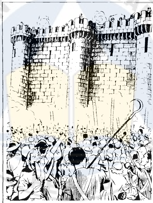
Merempuh Kota Bastille

Di Perlis Indera Kayangan sebuah dari daerah negeri Kedah pada masa lalu, terdapat beberapa kota pertahanan. Antaranya ialah Kota Indera Kayangan, Kota Sena, Kota Teluk Bua dan lain-lain yang menjadi benteng pertahanan daripada serangan musuh. Walaupun kota-kota di Perlis tidak sehebat dan