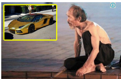
Homeless Man Buys a Lambo! You'll do a double take when you see how he did it jalopnik.com