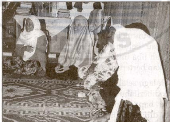
Wakil pihak lelaki dalam upacara melamar