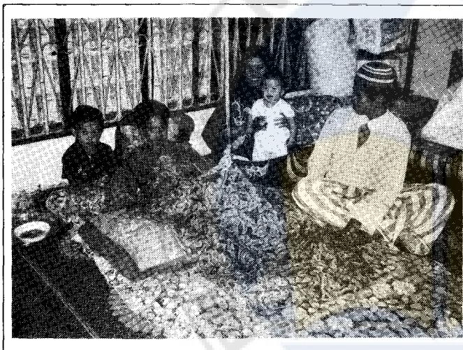
Kanak-kanak ini berehat di tempat yang disediakan khas selepas disunatkan

Menurut Ustaz Haji Abd. Khalil lagi, ada di sesetengah tempat, kalaulah seseorang anak itu hendak disunatkan maka kepala kanak-kanak itu akan dicukur sehingga licin. Setengahnya pula akan disimpan jambul atau ekor yang panjang di kepala kanak-kanak itu dan akan dicukur pada hari bersunat tersebut. Dalam hal ini, menurut kepercayaan orang tua-tua, tujuan mereka berbuat demikian kerana hendak menurut perbuatan nenek moyang mereka yang terdahulu. Kalau tidak berbuat demikian maka kanak-kanak itu akan mendapat sakit atau sebagainya. Tetapi pada masa sekarang, perkara itu tidak wujud lagi.